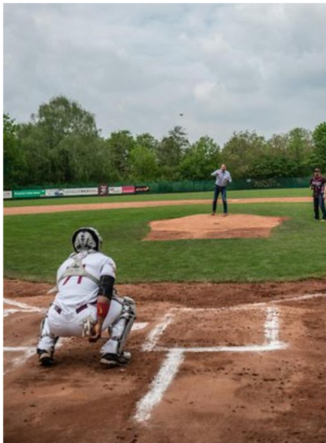
Schöne Perspektiven: Die Berlin Flamingos wollen Baseball in Berlin populärer machen.

Die Basis dafür, da ist man sich bei den Flamingos einig, muss im eigenen Nachwuchs gelegt werden. Zwar spielen auch im Norden Berlins zwei US-Amerikaner, die aber werden damit nicht reich. Neben einer Wohnung und einem BVG-Ticket erhalten sie noch eine Übungsleiter-Pauschale für eine Trainertätigkeit. „Viele Amerikaner machen das nach dem College ganz gerne, sammeln noch ein paar Erfahrungen in Europa“, sagt Markus B. Jaeger.